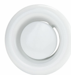
Frånluftsentil Ø100 stål