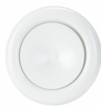
Tilluftsentil Ø100 stål