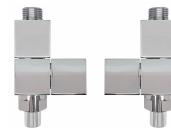
Radiatorventil fyrkant, vinkel